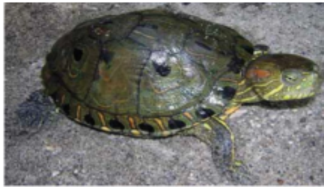
Imagen 1. Imagen de referencia en la que se aprecian los caracteres diagnósticos de Trachemys venusta callirostris (Tortuga hicotea).

La especie Trachemys venusta callirostris (Imagen 1) se caracteriza por ser semiacuática de tamaño moderado, tener la cabeza completamente lisa, tener un caparazón usualmente bajo y arqueado y un plastrón grande y bien desarrollado. Tiene el iris amarillo y la cabeza verde oliva, ornamentada con cintas longitudinales amarillas, y manchas redondeadas sobre el mentón y mandíbulas. El dorso de la cabeza está cubierto por piel lisa sin escamas y las extremidades están completamente palmeadas. En los recién nacidos la coloración es más vívida y el plastrón tiene un color amarillo con un complejo patrón verde oscuro que se desvanece a medida que la tortuga envejece. El caparazón oval en forma de domo tiene una carena baja y una coloración verde oliva o pardo oscura en los ejemplares adultos (Rueda-Almonacid et al, 2007) (Imagen 1).